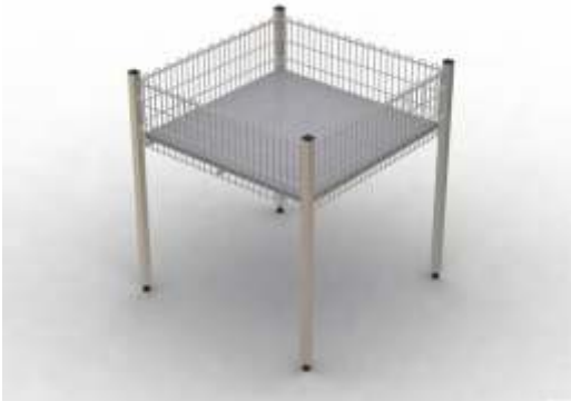
Teşhir Sepeti Exposition Basket

Kapasitesi : 200 kg. Capacity. : 200 kg. Ölçüler : 80 x 80 cm Sizes : 80 x 80 cm