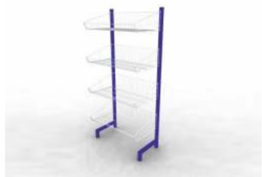
Tek Yönlü Teşhir Sepeti

Kapasitesi : 400 kg. Ölçüler : 50 x 50 cm