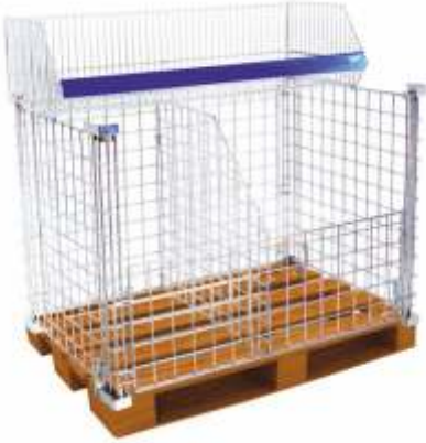
Palet Üstü Konteyner