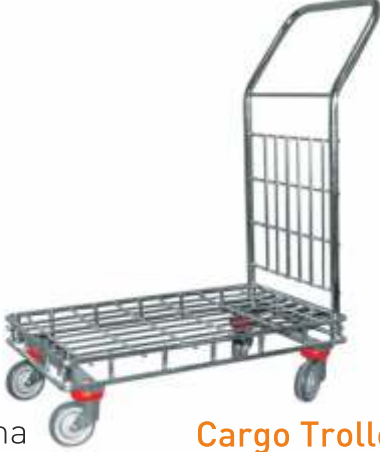
Yük Taşıma Arabası 150 kg