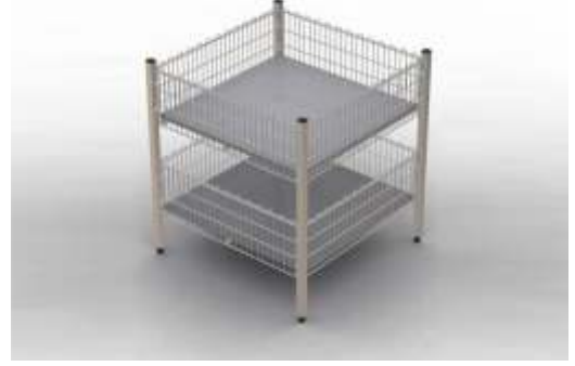
Kademeli Teşhir Sepeti Gradual Exposition Basket

Kapasitesi : 200 kg. Capacity. : 200 kg. Ölçüler : 71 x 71 x 95 cm Sizes : 71 x 71 x 95 cm