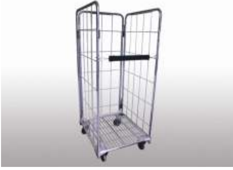
Rulot Koli Taşıma Arabası