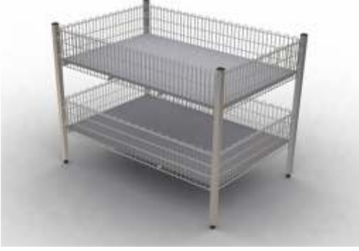
Kademeli Teşhir Sepeti

Taşıma Kapasitesi : 125 kg. Ölçüler : 80 x 120 cm