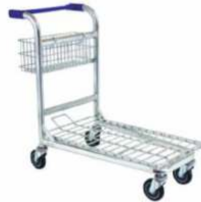
Yük Taşıma Arabası