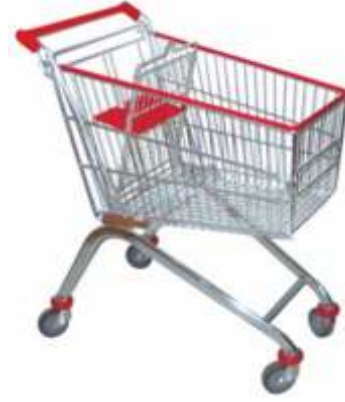
125 Lt. Market Arabası 125 Lt Shopping Cart