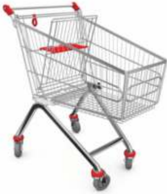
140 Lt Market Arabası 140 Lt Shopping Cart