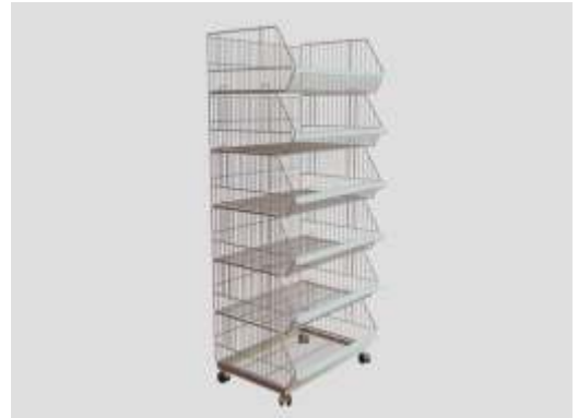
6'lı Aksiyon Sepeti

Kapasitesi : 300 kg. Ölçüler : 80 x 80 cm