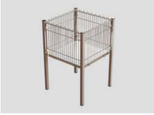
Teşhir Sepeti Exposition Basket

Taşıma Kapasitesi : 125 kg. Capacity. : 125 kg. Ölçüler : 55 x 55 x 80 Sizes : 55 x 55 x 80