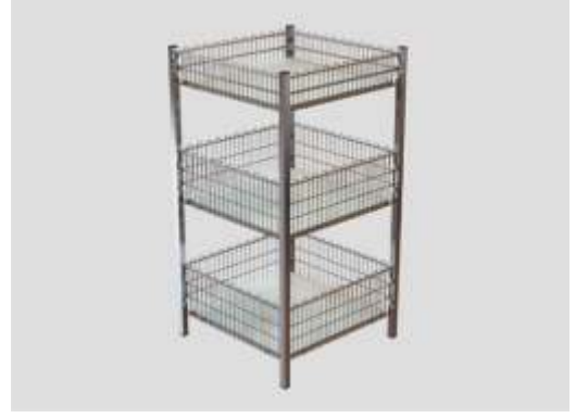
Teşhir Sepeti Exposition Basket

Taşıma Kapasitesi : 125 kg. Capacity. : 125 kg. Ölçüler : 55 x 55 x 80 Sizes : 55 x 55 x 80