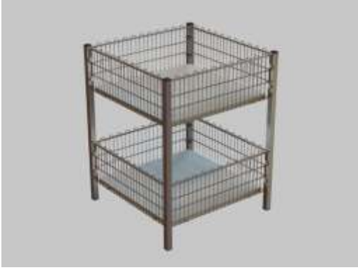
Teşhir Sepeti Exposition Basket

Kapasitesi : 200 kg. Capacity. : 200 kg. Ölçüler : 71 x 71 x 135 cm Sizes : 71 x 71 x 135 cm