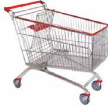
210 Lt Market Arabası 210 Lt Shopping Cart