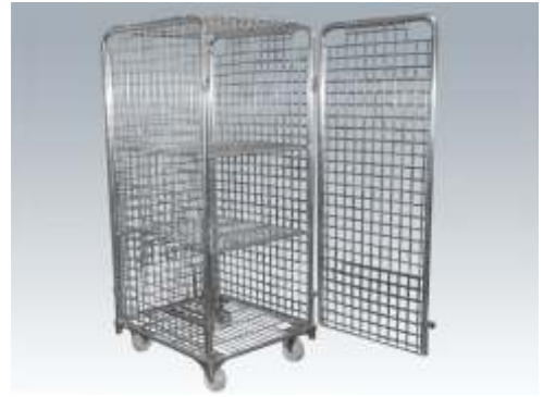
4 Kapaklı Rulot 4 Covers Rulot