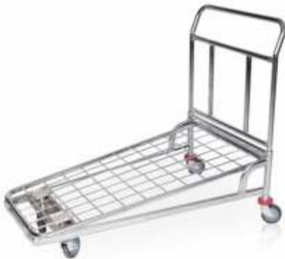
Yaylı Koli Taşıma Arabası