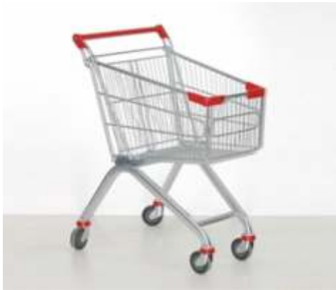
25 Lt. Market Çocuk Arabası