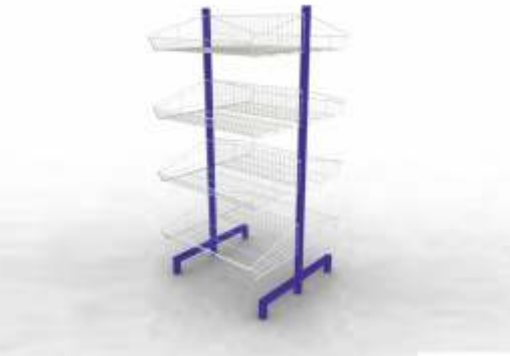
Çift Yönlü Teşhir Sepeti

Capacity. : 200 kg. Sizes : 85 x 85 x 85 cm