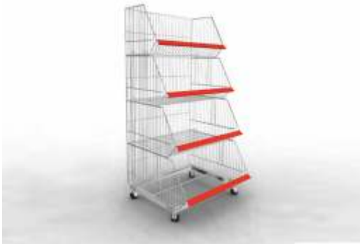
3 ve 4 Katlı Aksiyon Sepeti

Taşıma Kapasitesi : 300 kg. Ölçüler : 55 & 120 cm