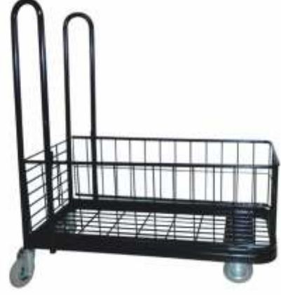
Yük Taşıma Arabası 250 kg