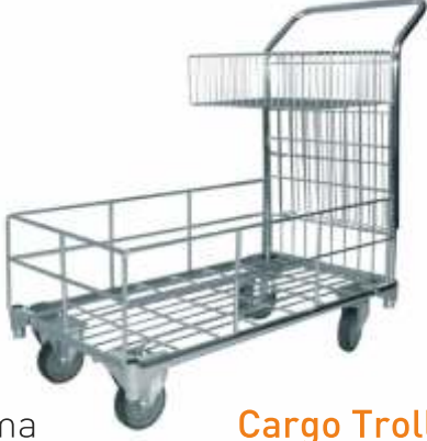
Yük Taşıma Arabası 250 kg