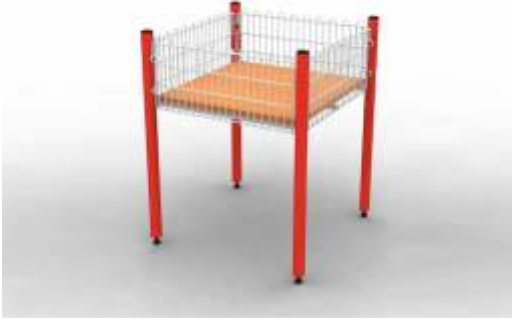
Kademeli Teşhir Sepeti

Taşıma Kapasitesi : 125 kg. Ölçüler : 55 x 55 x 80