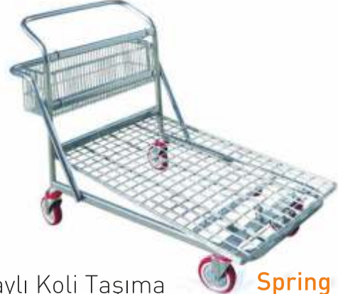
Yaylı Koli Taşıma Arabası