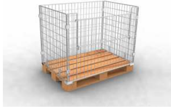
Palet Üstü Konteyner