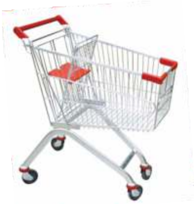
100 Lt Market Arabası 100 Lt Shopping Cart