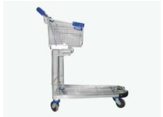
Elektronik Mağaza Arabası