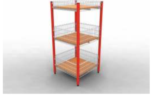
Kademeli Teşhir Sepeti

Capacity. : 125 kg. Sizes : 55 x 55 x 80