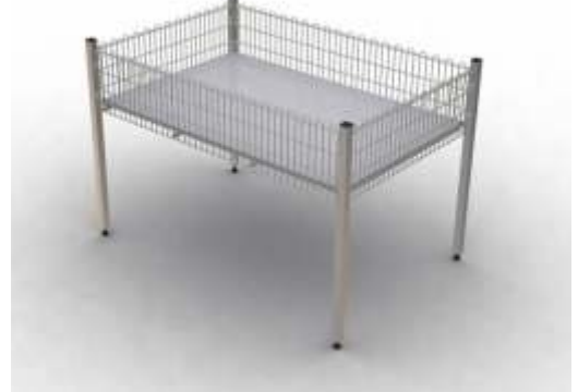
Teşhir Sepeti Exposition Basket

Kapasitesi : 200 kg. Capacity. : 200 kg. Ölçüler : 80 x 80 cm Sizes : 80 x 80 cm